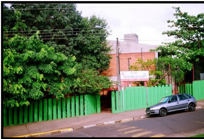
Prédio construído em 1987 para a instalação de E. E. Prof.ª Iracema de Oliveira Carlos”